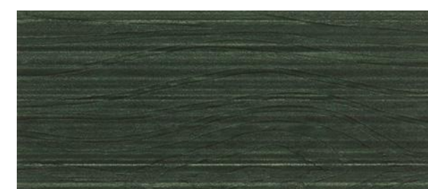
C17 VERDE - Green