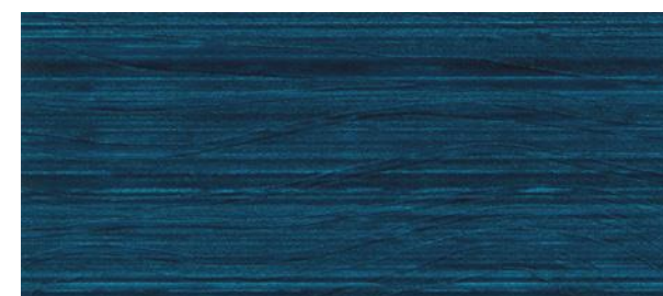
C18 BLU - Blue