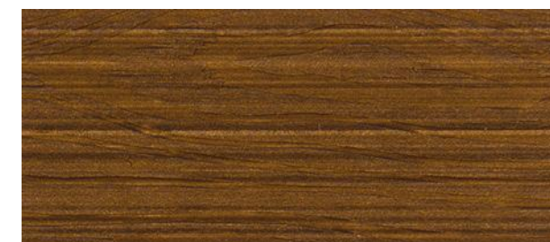
C15 NOCE CALDO - Mellow walnut