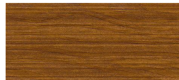
C14 NOCE BIONDO - Light walnut