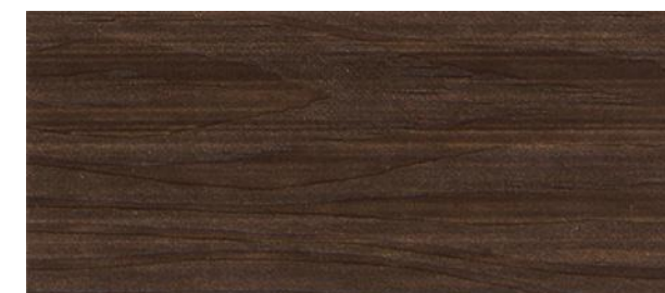
C33 NOCE BRENNERO - Brennero walnut