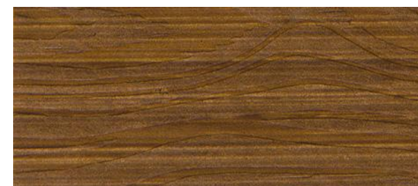
C23 NOCE ROSSO - Red walnut