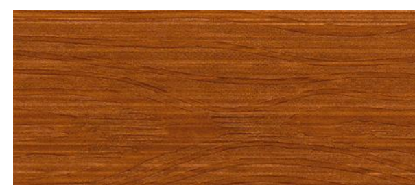
C16 MOGANO - Mahogany