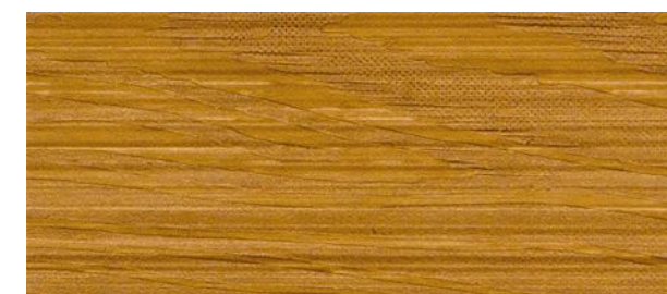
C19 BRUNO CHIARO - Light brown