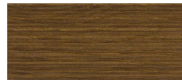
C21 NOCE SCURO - Dark walnut