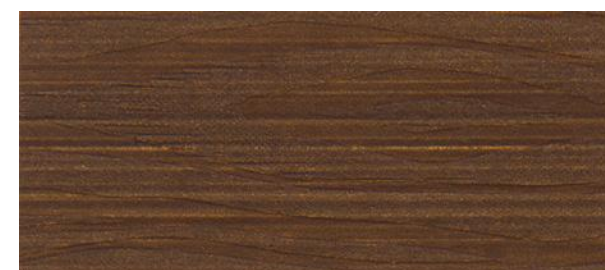
C12 NOCE BRUNO - Brown walnut